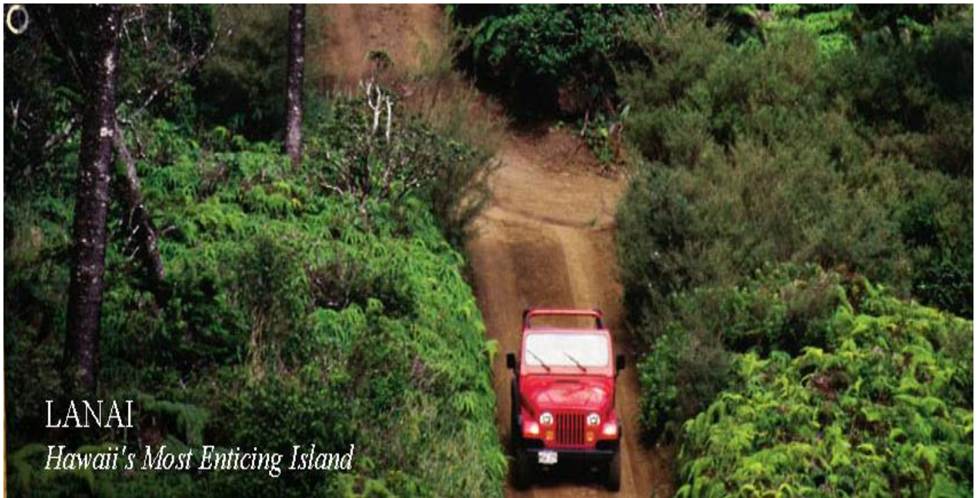
LANAI Hawaii's Most Enticing Island