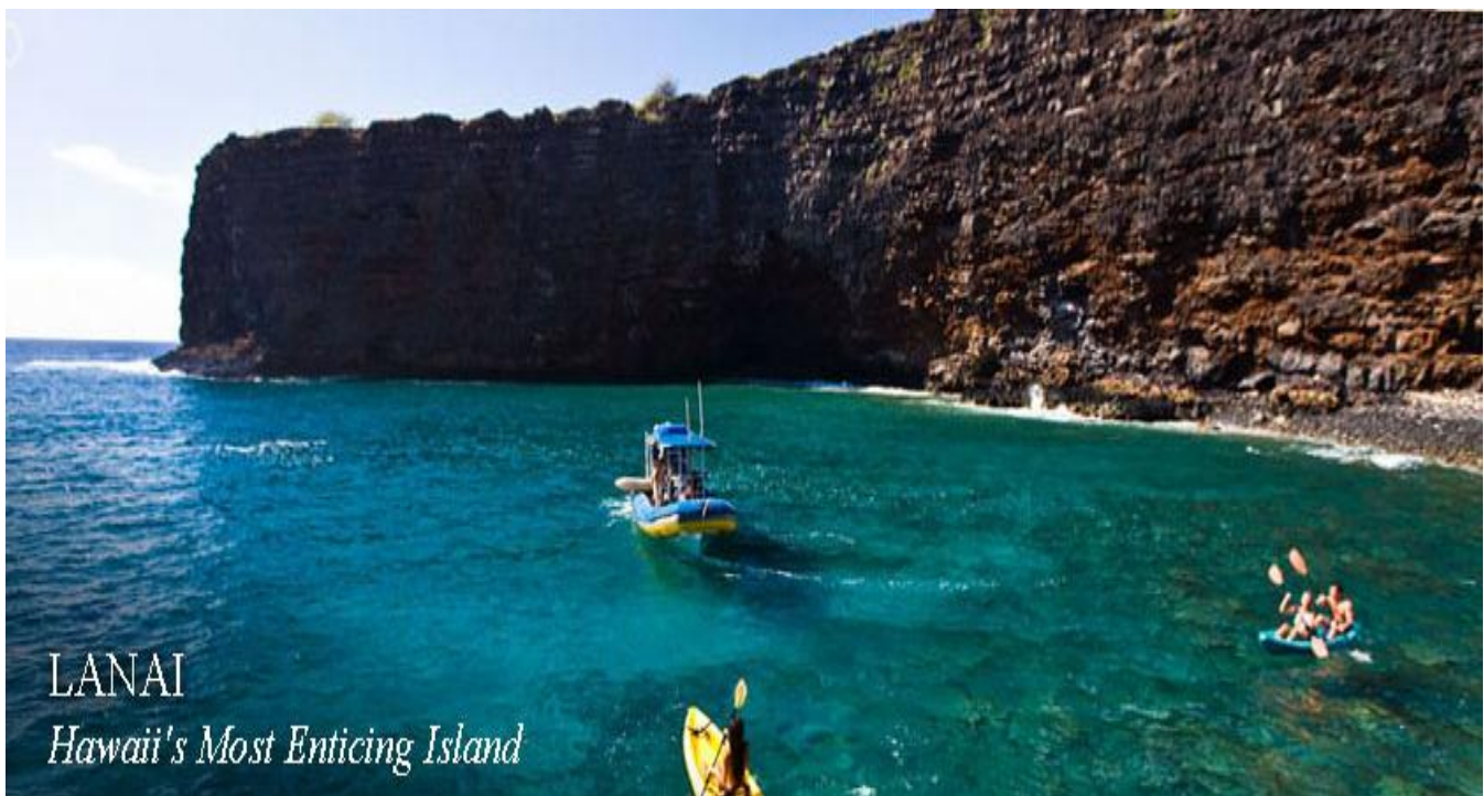
LANAI Hawaii's Most Enticing Island