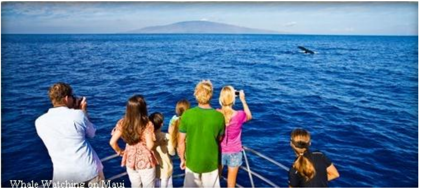
Whale Watching on Maui