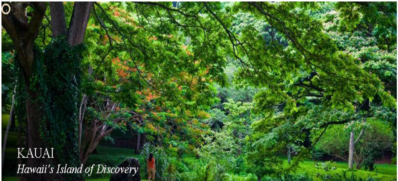
KAUAI Hawaii's Island of Discovery