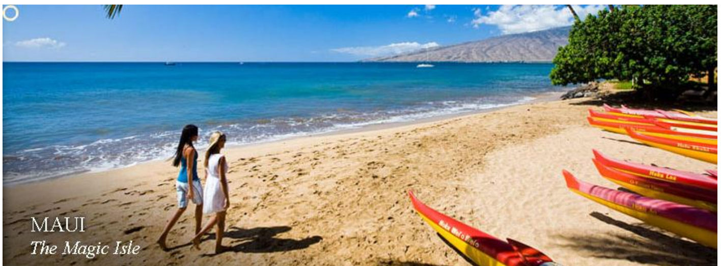
MAUI The Magic Isle